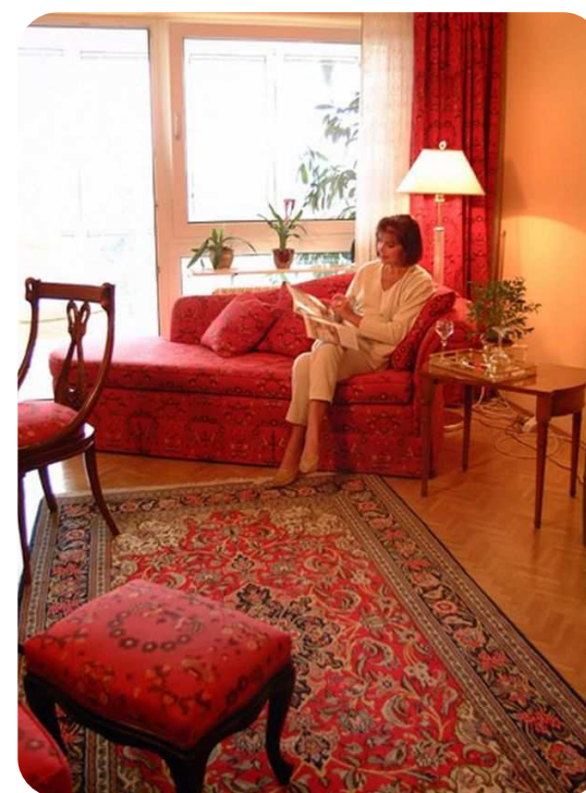
Exklusivzimmer „Orchidee“ in der HG Naturklinik Michelrieth

Gerne! Im Rosenhaus gleich nebenan oder in der HG Naturklinik finden Sie charmant eingerichtete Zimmer und Suiten von günstig bis exklusiv.